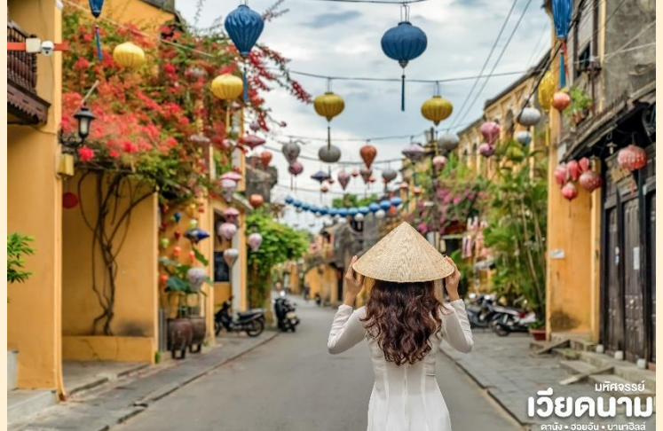
บศักรรย์ เวียดนาม ดานัง • ฮอยอัน • บานาฮิลล์