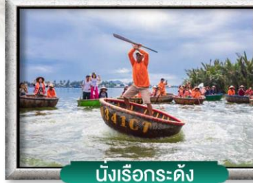
นั่งเรือกระดัง