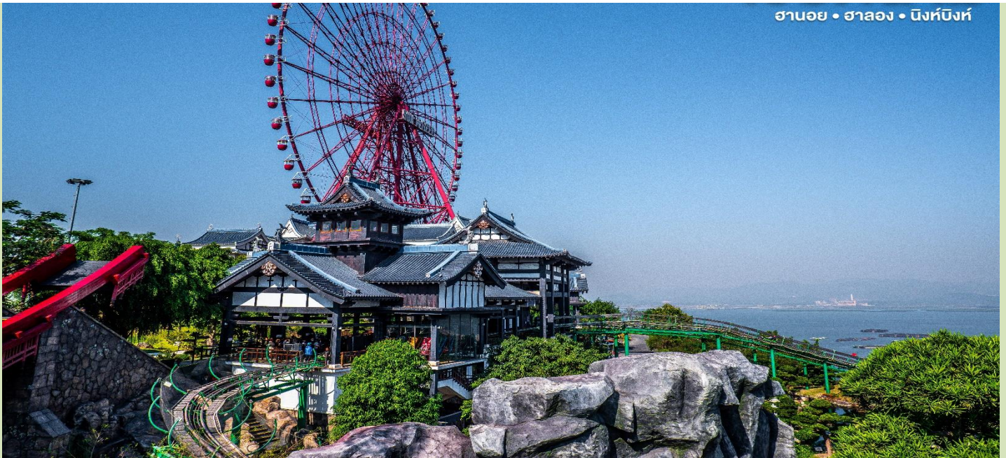
ฮานอย • ฮาลอง • นิงห์บิงห์