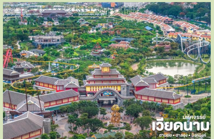
บหัทศจรรย เวียดนาม ฮานอย • ฮาลอง • นิงห์บิงห์

📍 นำท่าน นั่งกระเช้าที่ใหญ่ที่สุดในโลก ( Queen Cable Car ) เป็นกระเช้าลอยฟ้า 2 ชั้นที่ใหญ่ที่สุดในโลกซึ่งจะนั่งกระเช้าข้ามทะเลไปตามระยะทาง 2,165 เมตร ทำให้เห็นวิวทิวทัศน์ที่สวยงามของเมืองฮาลองในมุมสูงเพื่อเดินทางไปยังสวนสนุก ( Sun World Halong Complex ) เป็นสวนสนุกที่รวมความบันเทิงอันทันสมัยบนภูเขา Ba Deo มีเครื่องเล่นมากมาย ภายในสวนสนุกยังมีสวนญี่ปุ่น พิพิธภัณฑ์หุ่นขี้ผึ้ง โรงละครหุ่นกระบอก โดยมีแลนด์มาร์คของสวนสนุก คือ ชิงช้าวงสีแดง Sun Wheel เป็นชิงช้าที่มีขนาดใหญ่และสามารถชมวิฮาลองเบย์แบบมุมสูงได้ 360 องศา และนำท่านแวะชม ร้านหยก เพื่อเลือกซื้อเป็นของที่ระลึก