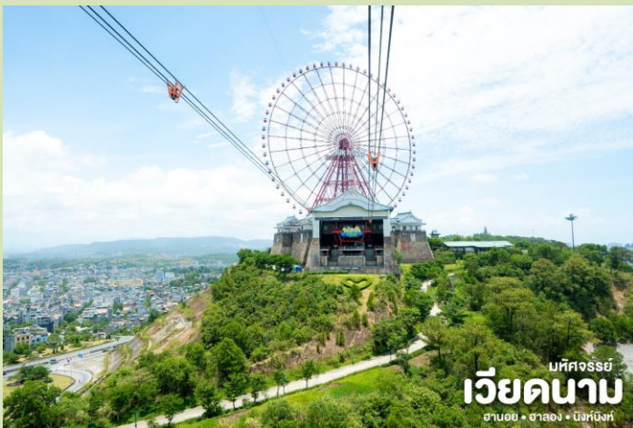
บหัทศจรรย เวียดนาม ฮานอย • ฮาลอง • นิงห์บิงห์