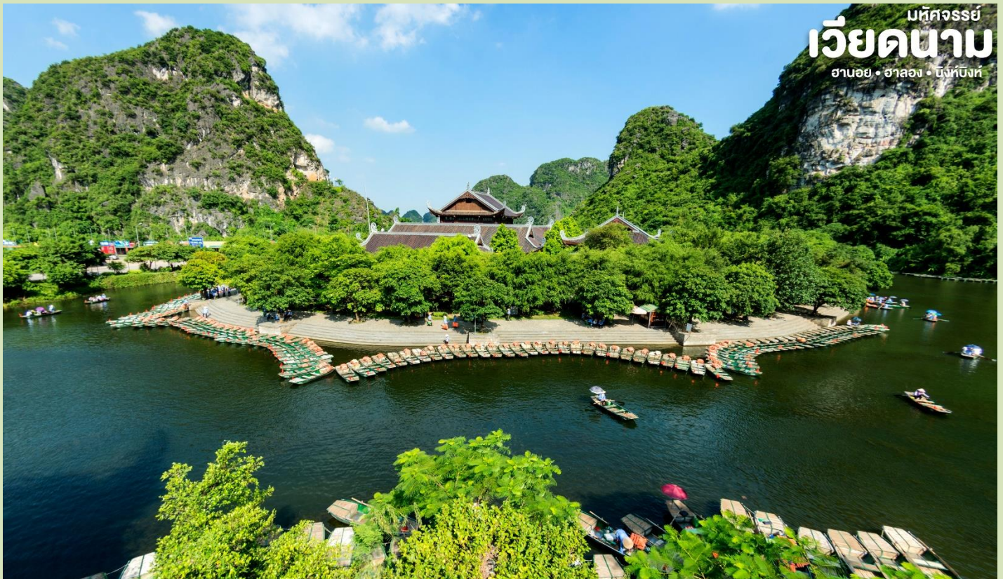
มหัศจรรย์ เวียดนาม ฮานอย • ฮาลอง • ฮึงห์บิงห์

จากนั้น นำท่านล่องเรือ จ่างอแง (Thung nǎng) เป็นพื้นที่ที่มีทั้งภูมิทัศน์อันงดงามของยอดเขาหินปูน แม่น้ำหลายสายไหลลัดเลาะ บางส่วนจมอยู่ใต้น้ำและยังถูกล้อมรอบด้วยผาสูงชันจึงทำให้สถานที่แห่งหนึ่งงดงาม น่าชม มีร่องรอยทางโบราณคดีที่เผยให้เห็นการตั้งถิ่นฐานของมนุษย์สมัยโบราณ ทำให้สถานที่แห่งนี้ได้รับการขึ้นทะเบียนเป็นมรดกโลกทางวัฒนธรรมและธรรมชาติ โดยล่องตามเส้นทาง Thung nǎng