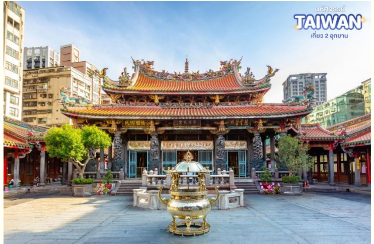
บ๊องจอร์จ TAIWAN เที่ยว 2 อุทยาน

เป็นหนึ่งในวัดที่เก่าแก่และมีชื่อเสียงมากที่สุดแห่งหนึ่งของเมืองไทเป เพื่อเป็นสถานที่สักการะบูชาสิ่งศักดิ์สิทธิ์ตามความเชื่อของชาวจีน ที่เชื่อกันว่าเป็นเทพผู้ผูกด้ายแดงให้สมหวังด้านความรัก จนบางคนเรียกกันว่าเป็นวัดสไต้ไต้หวัน ทำให้ที่นี่เป็นอีกหนึ่งแหล่งท่องเที่ยวไม่ควรพลาดของเมือง