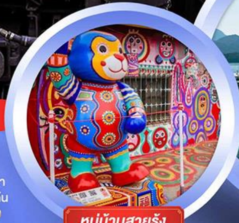
หมู่บ้านสายรุ้ง